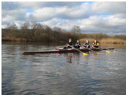
Ein Team auf Zeit – oder länger?

Verlangen Sie unsere unverbindliche Offerte. www.rc-hallwilersee.ch - a place to stay