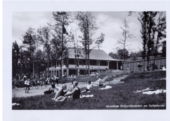
die Badi - Postkarte von anno dazumal

Der Ruderclub Hallwilersee befindet sich im Areal der ältesten, 1928 erbauten Badeanstalt der Schweiz, der Seerose in Meisterschwanden. Eine südexponierte Spitzenlage verbindet sich mit der Charme vergangener Badekultur.